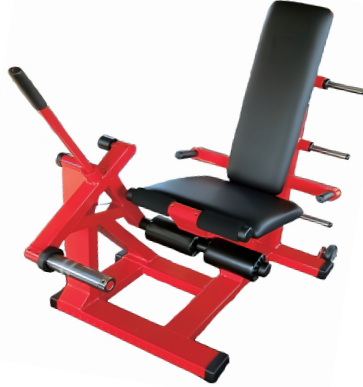
曲げ楽訓 W760/D1300/H1280 重量 70 kg