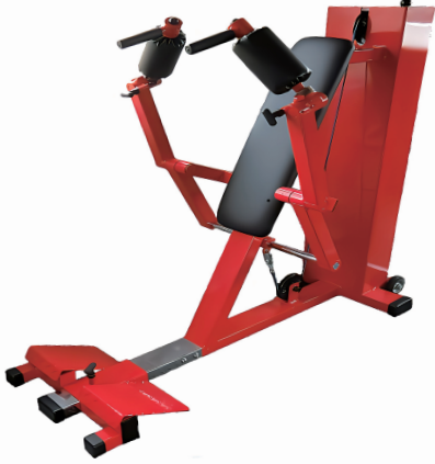
起き上がり訓 W710/D1540/H1350 重量 142 kg