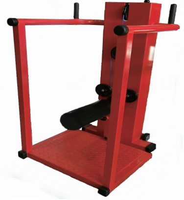
膝振り訓 W705/D860/H1350 重量 145 kg