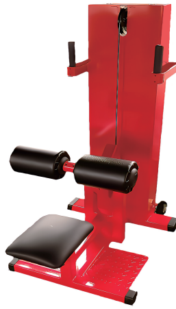
立ち上がり訓 W600/D1050/H1350 重量 126 kg