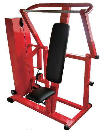
腕振り訓 W1290/D800/H1450 重量 155 kg