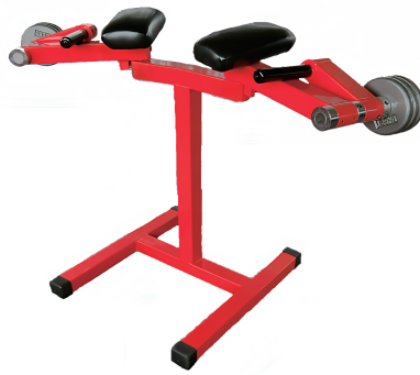
肩楽訓 W1030/D550/H830 重量 24 kg