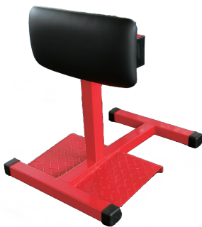
前屈訓 W510/D650/H670 重量 15 kg