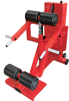
腰楽訓 W860/D1060/H860 重量 122 kg