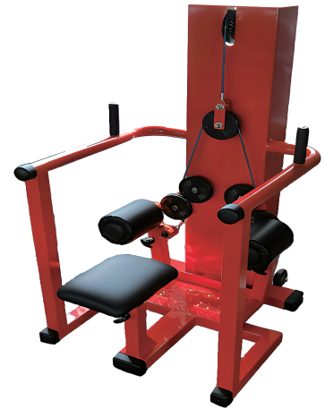
開け閉め訓 W700/D960/H1350 重量 139 kg