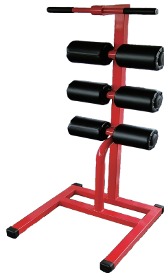
開脚訓 W600/D650/H1480 重量 23 kg