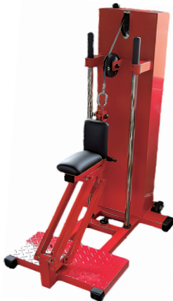
立ち屈み訓 W600/D900/H1350 重量 142 kg