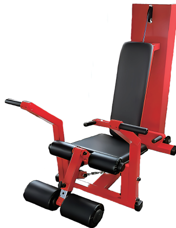
蹴り上げ訓 W870/D1380/H1350 重量 142 kg