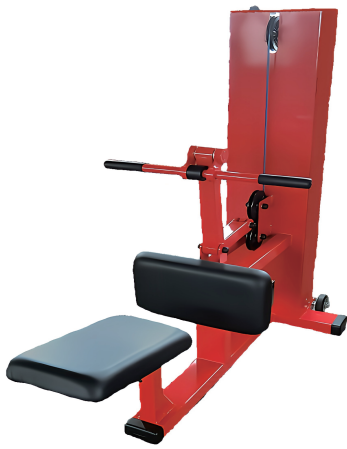
押し引き訓 W600/D1380/H1350 重量 127 kg