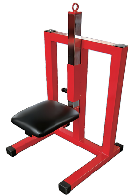
診断椅子 W500/D500/H800 重量 20 kg