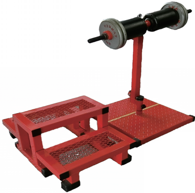
膝楽訓 (階段セット) W960/D710/H890 (本体) 重量 57 kg (本体)