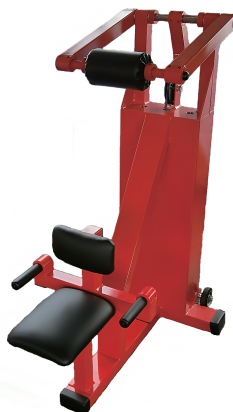
顔上げ訓 W600/D1020/H1250 重量 116 kg